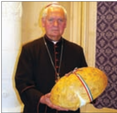
Idén is óriás ünnepi kenyérral tisztelte meg Püspök urat a Pécsi Sütőipari Rt. A kenyeret a Püspöki Palotában adták át.