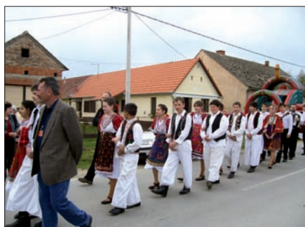
3. Sztárai táncosok Sopje főutcáján...