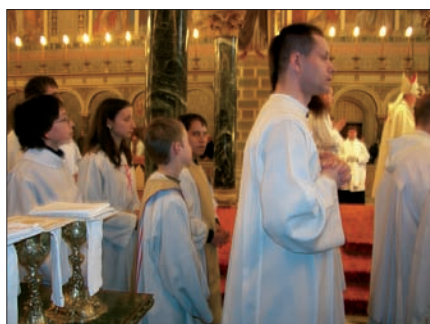
2. Hűséges sztárai szolgálattelvőink a nagycsütörtöki olajszentelési misén, a Pécsi Bazilikában