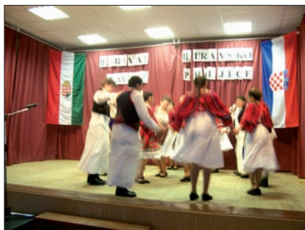
4. ...és a sztárai Kultúrház színpadán