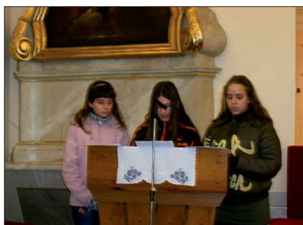
1. Drávasztárai lányok vezetik a keresztutat a sellyei templomban

Talán, immár második éve valami elkezdődött, valamit megérezhettünk abból, hogy komolyan vesszük: mi is feltámadhatunk Jézussal együtt. (5. kép)