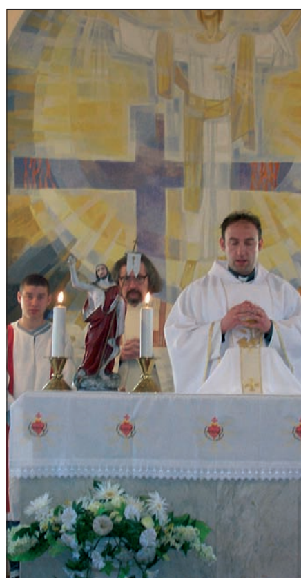
5. Horvát szentmise Drávasztárán