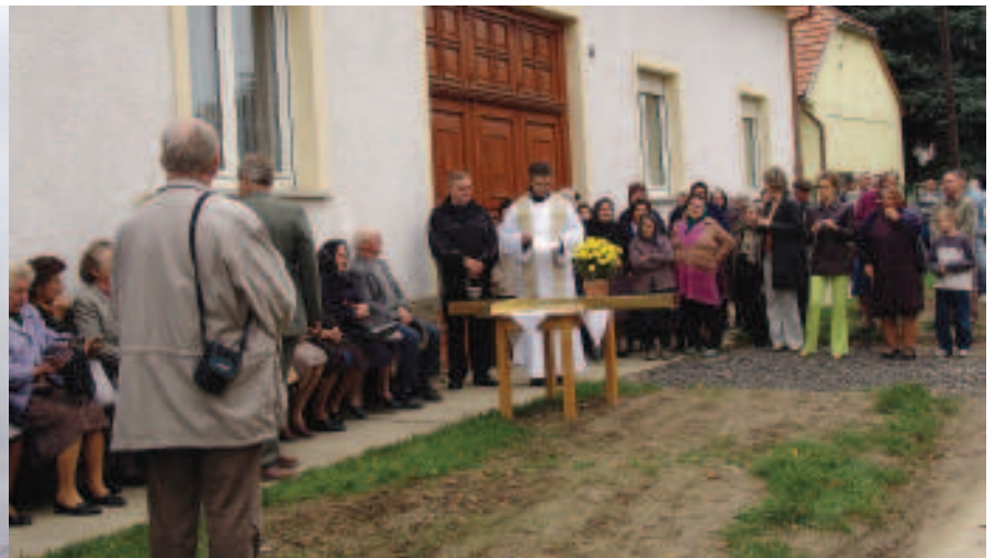
Új tornyot kapott a nyomjai templom