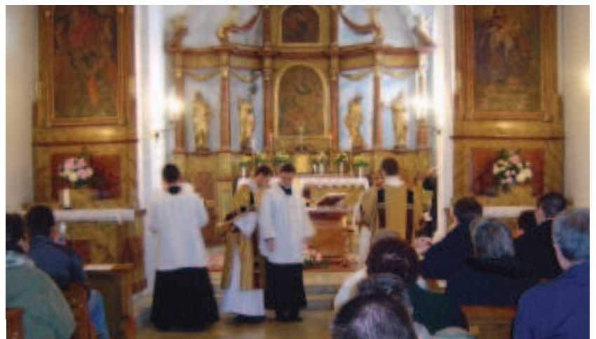
Admissiót és beöltöztetést tartottak a Püspöki Szemináriumban november 21-én, a délelőtti szentmise keretében. E napon mutatkoztak be a Szeminárium papnövendékei, akik felvételüket kérték az egyházi rendbe, és e napon öltötte magára három fiatal első alkalommal a papi reverendát.