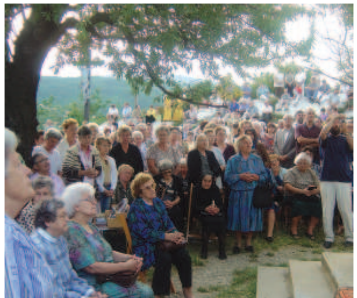
Havasboldogasszony napján idén is háromnapos búcsúval köszöntötték a Szűzanyát a pécsi Havihegyen. Az augusztus 5-i ünnepi szentmisét Mayer Mihály megyéspüspök úr celebrálta.