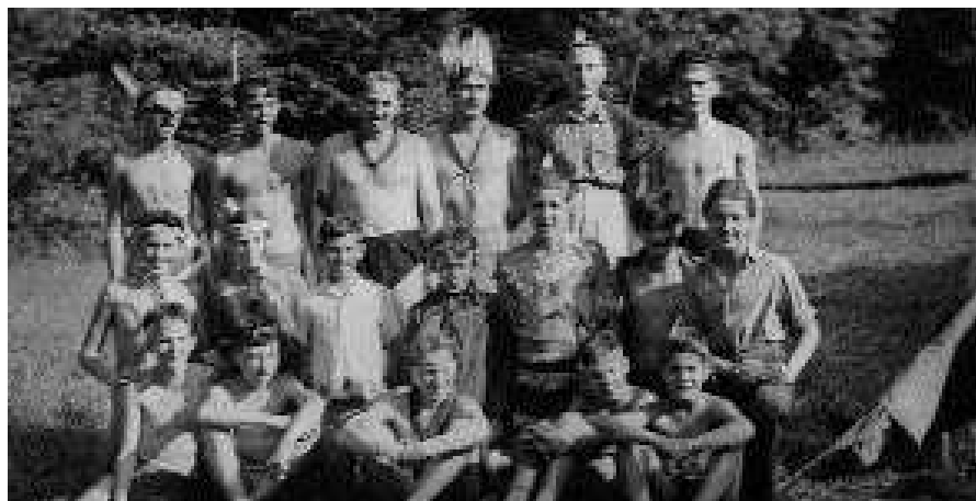
Tifkos cserkész-tábor a Mecsekben, 1955 nyarán