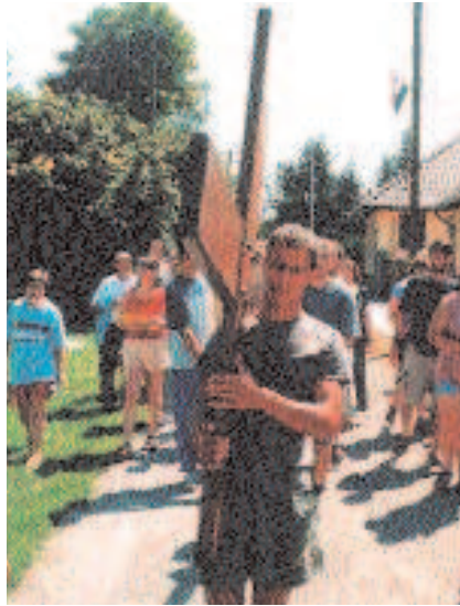
A közép-európai találkozó keresztje

Ifjúsági zarándoklat Mariazellbe. Időpont: 2004. május 21–23., péntek–vasárnap. Helyszín: Mariazell, Ausztria. Részletes információk kérhetők az informatika@katolikus.hu címen.