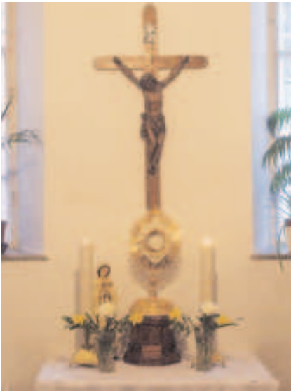
Az Ágoston téri templomban

Van egy életmentő, sürgős feladat itt a Pécsi Egyházmegyében, az egész országban, Európában, sőt az egész világon. Ne hagyjuk magára az Oltáriszentségben köztünk maradt élő Krisztust! Ne zárjuk be a templomokat, ahol a Tabernákulum mélyén ott van az egyedüli éltető erőforrásunk! Meg kell szervezni, hogy valaki mindig legyen az Oltáriszentség mellett. Soha ne legyen egyedül. Nehéz elképzelni, hogy azok, akik Krisztus-követőnek tartják, vallják magukat, ne igennel válaszolnának a kérdésre: „Tudsz-e egy órát a hét százhatvannyolc órájából az Oltáriszentségben köztünk élő Krisztussal, Őt imádvá, őrizve eltölteni?” A személyes vállaláson van itt a hangsúly.