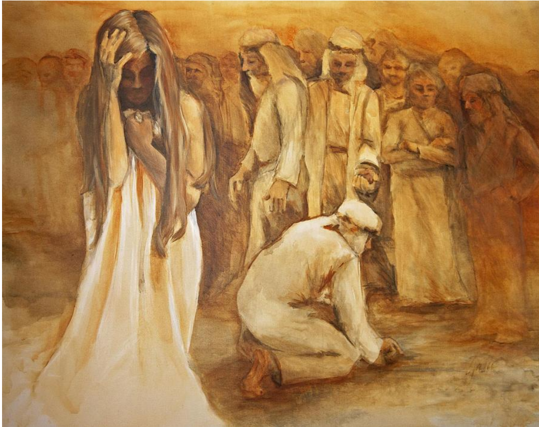
Jani Freimann: Mercy (Irgalom), 2011