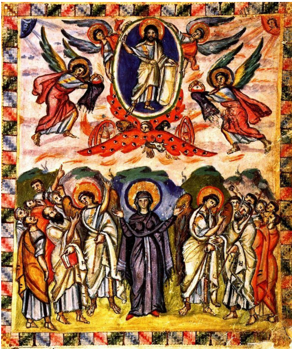
Urunk Mennybemenetele – ábrázolás a 6. századi szír Rabula-kódexből ( https://i.pinimg.com/originals/26/c4/d8/26c4d8aeffd51cadd223575c7771834.jpg )