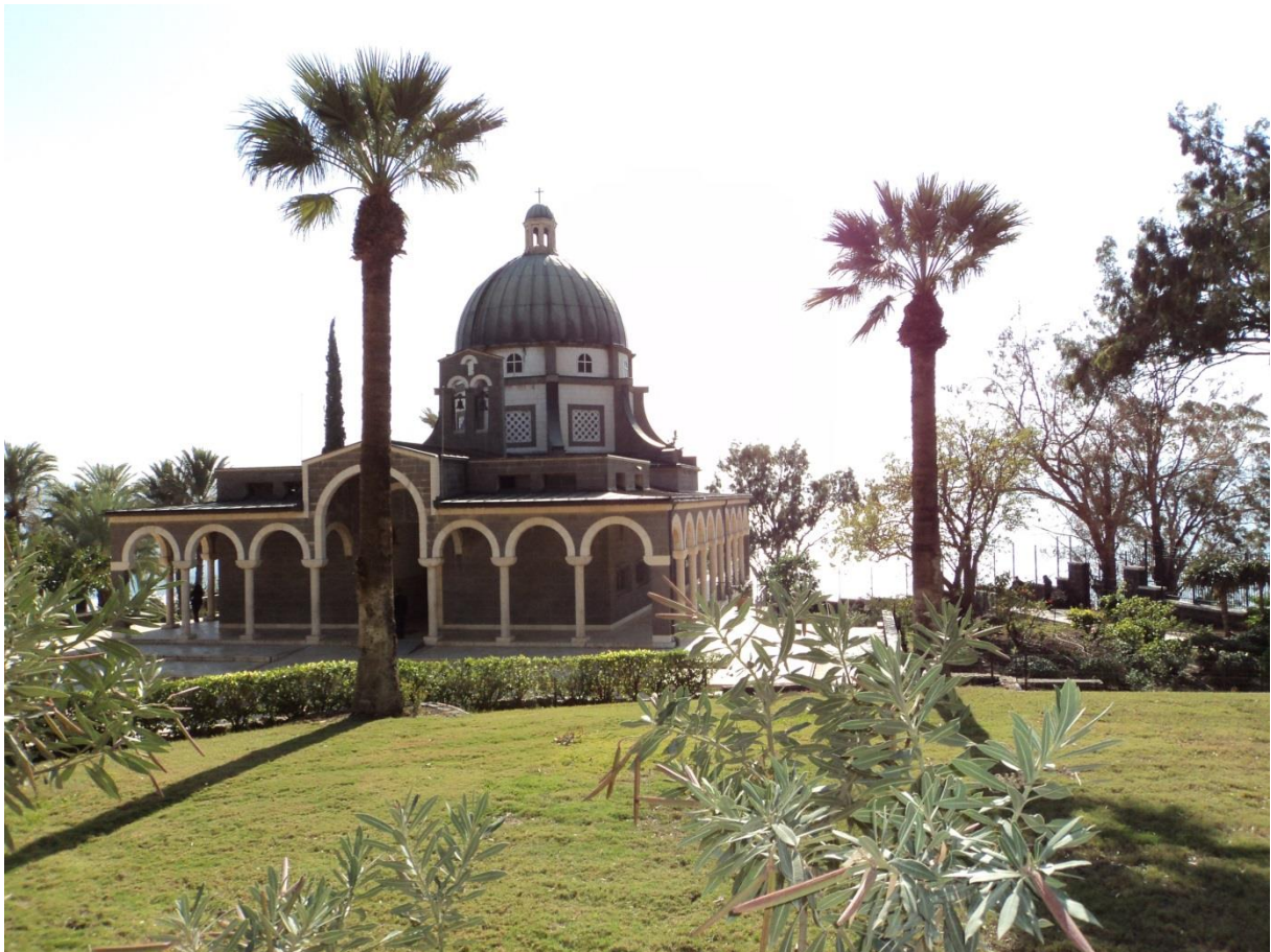
A Nyolc Boldogság-hegyi templom a Szentföldön