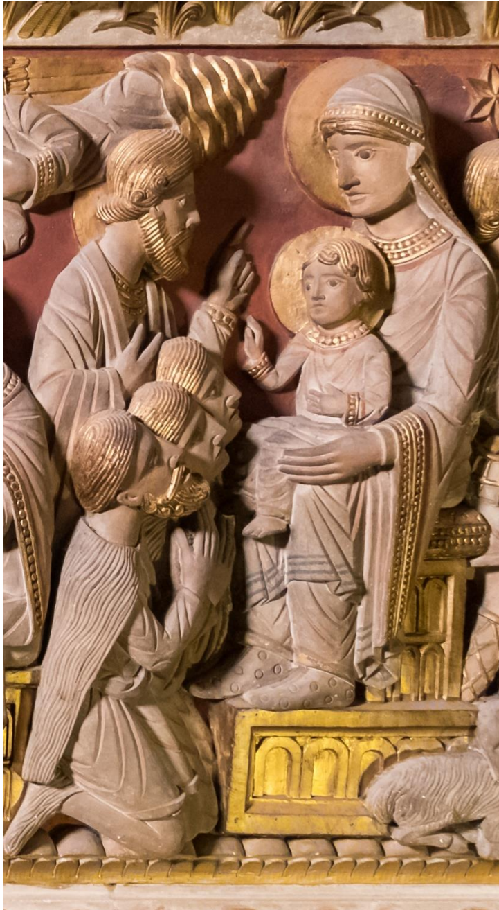
A pásztorok imádása, 12. századi dombormű a székesegyház altemplomának déli lejáratáról