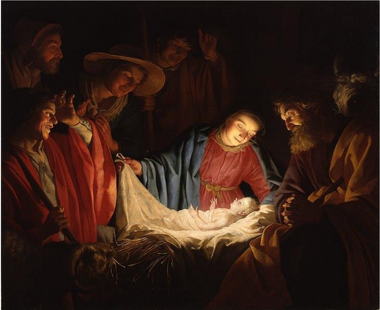
Gerard van Honthorst: A pásztorok imádása (1622)