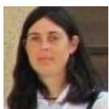
Nagy Katalin Ciszterci Nevelési Központ, tanár

Néri Szent Fülöp Katolikus Általános Iskola Néri Szent Fülöp Tagóvodája, óvodapedagógus