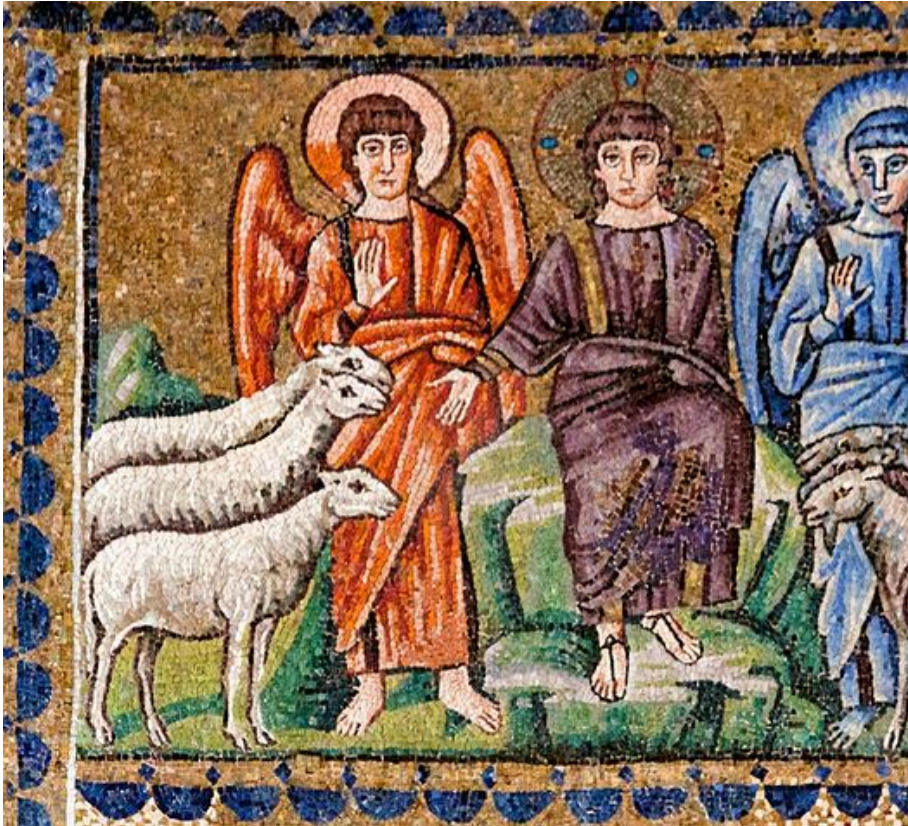
Utolsó ítélet – A juhok és kosok szétválasztása. 6. század körül készült mozaik a Saint ApollinareNuovo bazilikából (Ravenna, Olaszország)