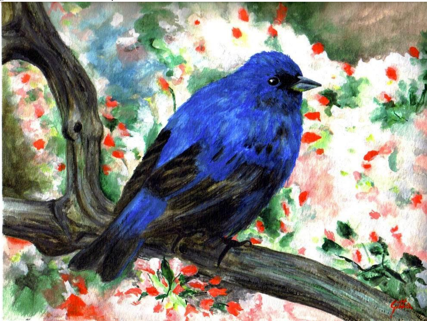
Varga Gitta kortárs festő