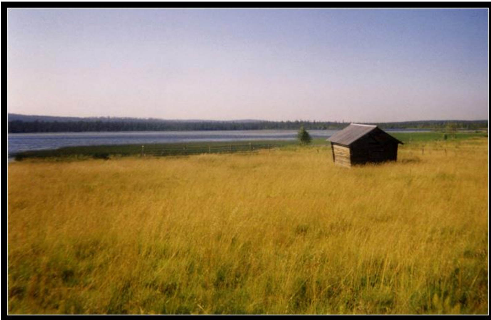
The little house in the meadow