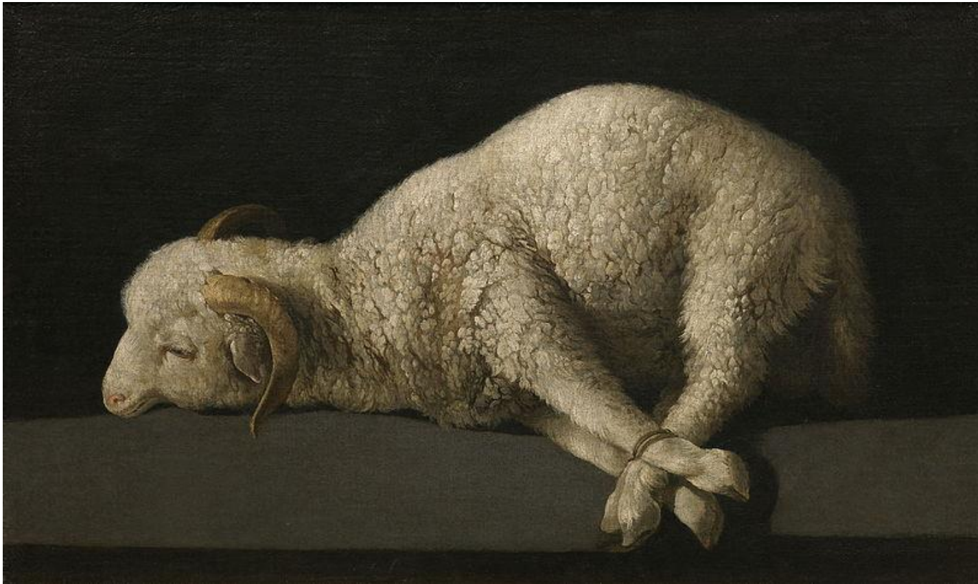
Francisco de Zurbarán: Agnus Dei

Zurbaran, Francisco de, spanyol festő, Fuente de Cantosban (Estremadura) született 1598, meghalt Madrid 1664 körül. A XVII. században, Sevilleban működő mesterek egyik legjelentékenyebbike, a legspanyolabb festők egyike. Szerzetesek és azok legendáinak epikus, kibén a szerzetesek komor aszkézise és fanatikus hite talált ritka megértésű szószólóra. Realisztikus ábrázolásának nyugalma csaknem a józan egyszerűségét érinti olykor.