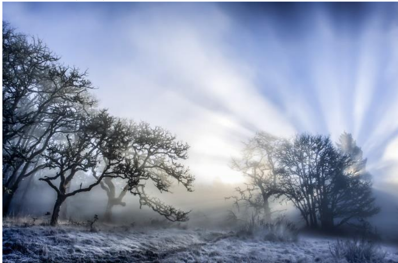
Stan Newman-Let there be light