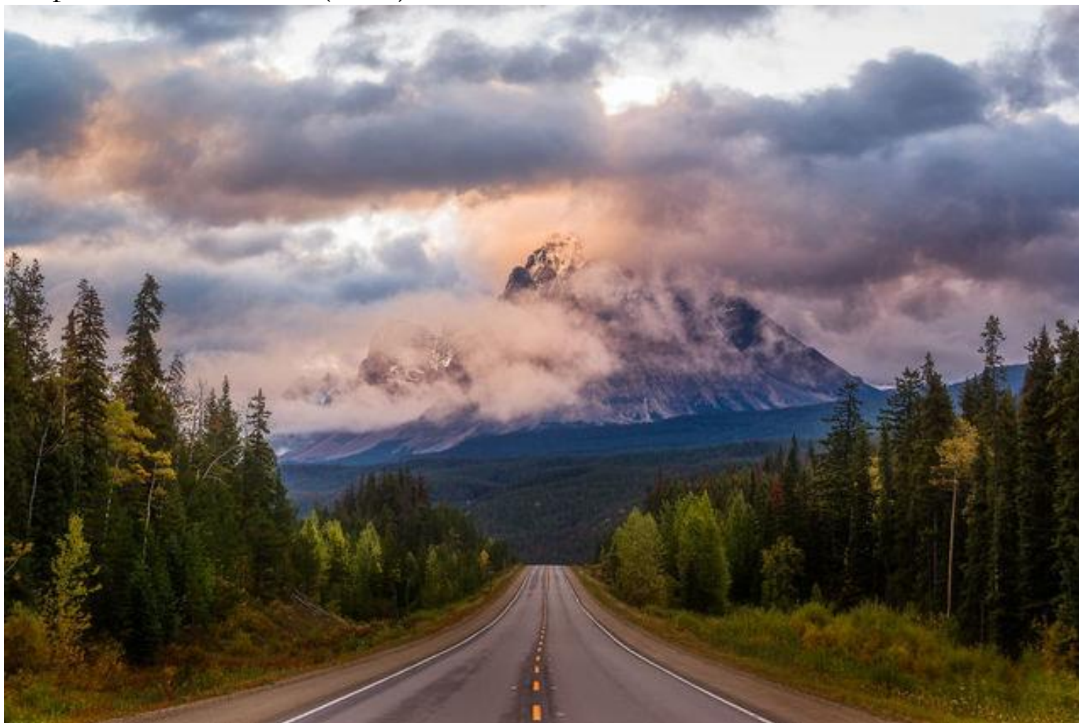
Jimmy Dau ausztrál fotós