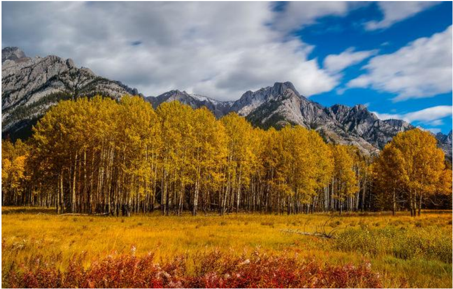
Jimmy Dau ausztrál fotós